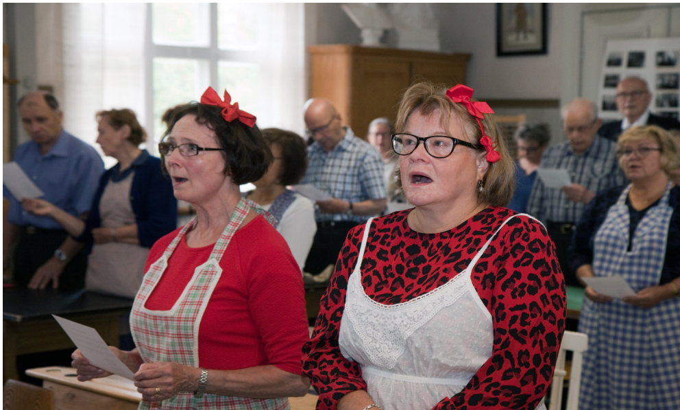
Kaikki lauloivat täysin rinnoin.