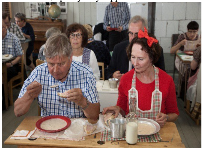
Ruokatunnilla saimme koulusta ohranryynivelliä. Mukana meillä oli voikakkoeväät ja maitopullo