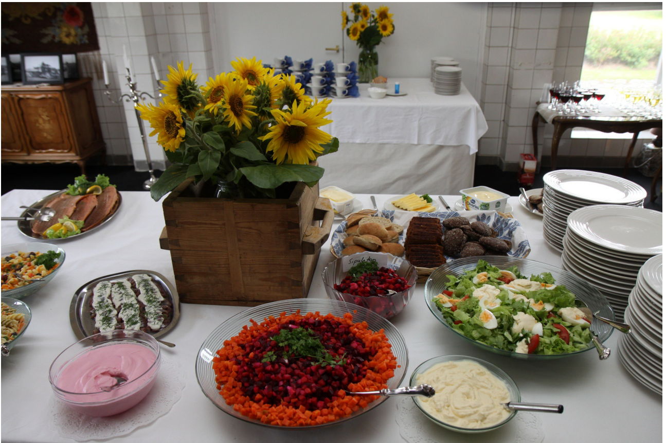
Juhlapäivällinen oli erinomaisen maistuva.