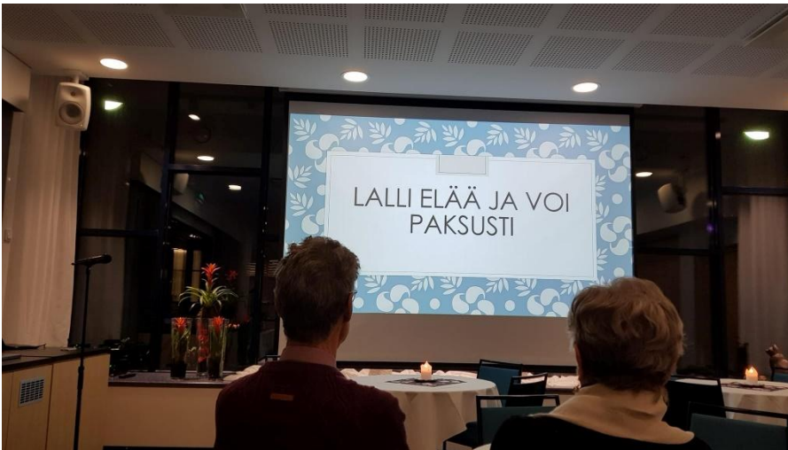
Näinhän se on! köyliöläissyntyinen mielellään ajattelee.