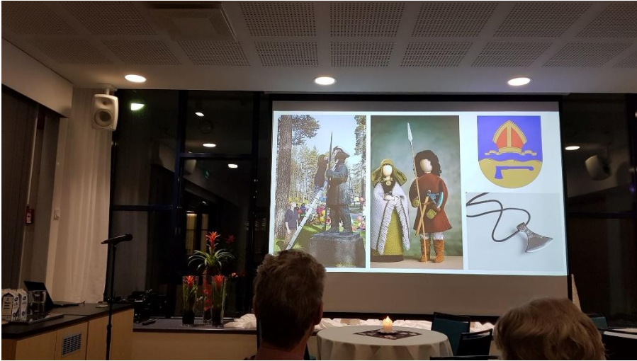
Säkylän Köyliössä Lalli on läsnä näkyvästi yhä edelleen.