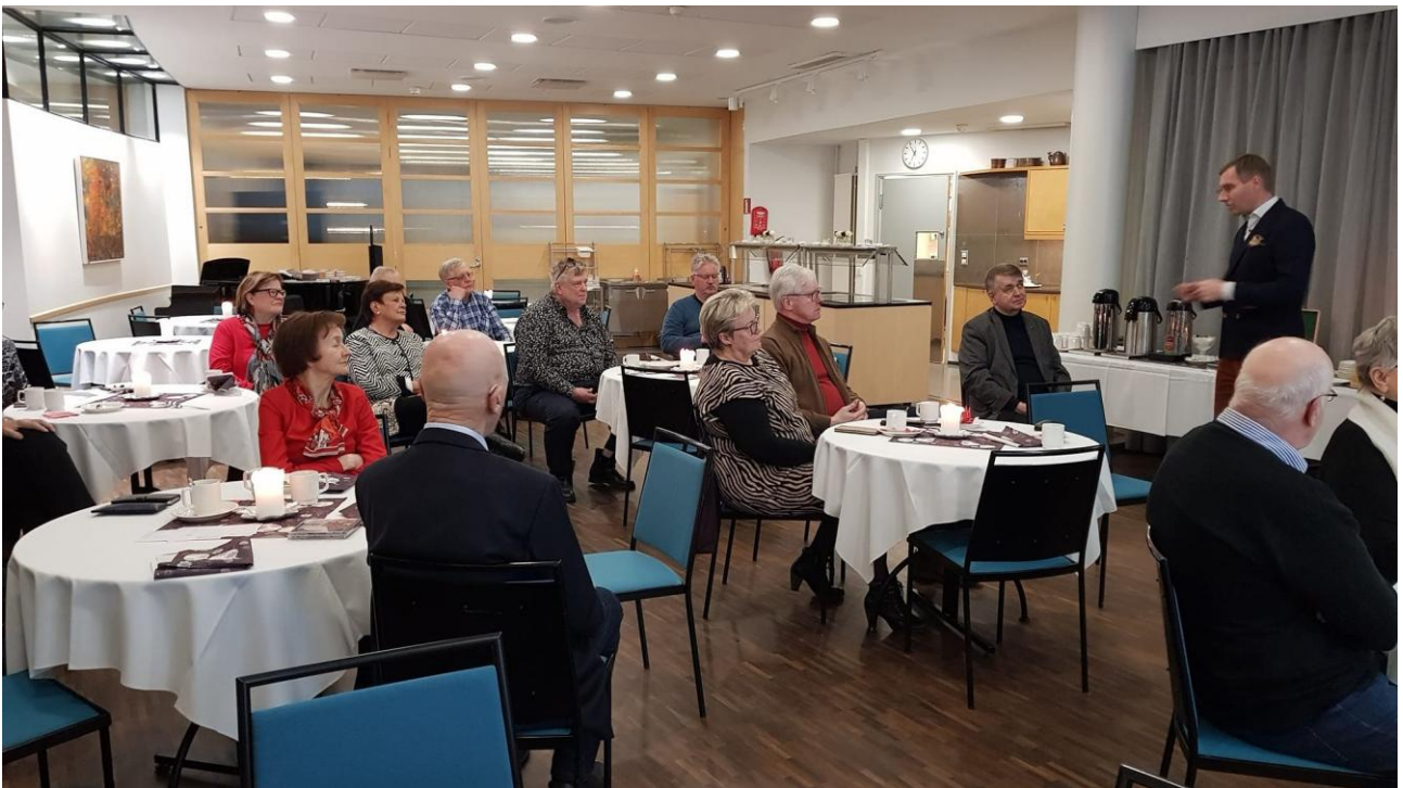
Luennon jälkeen syntyi vilkas keskustelu.