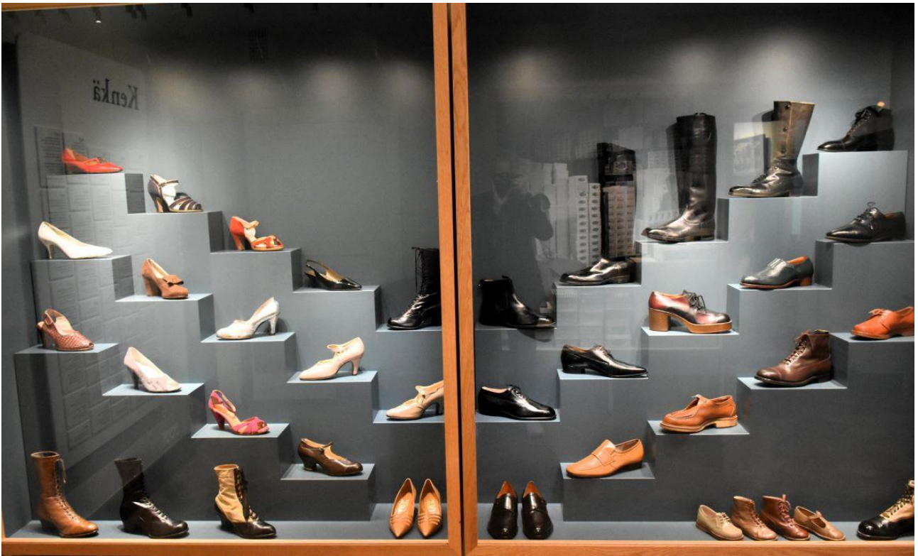
Aaltosen kenkätehtaiden tuotteita