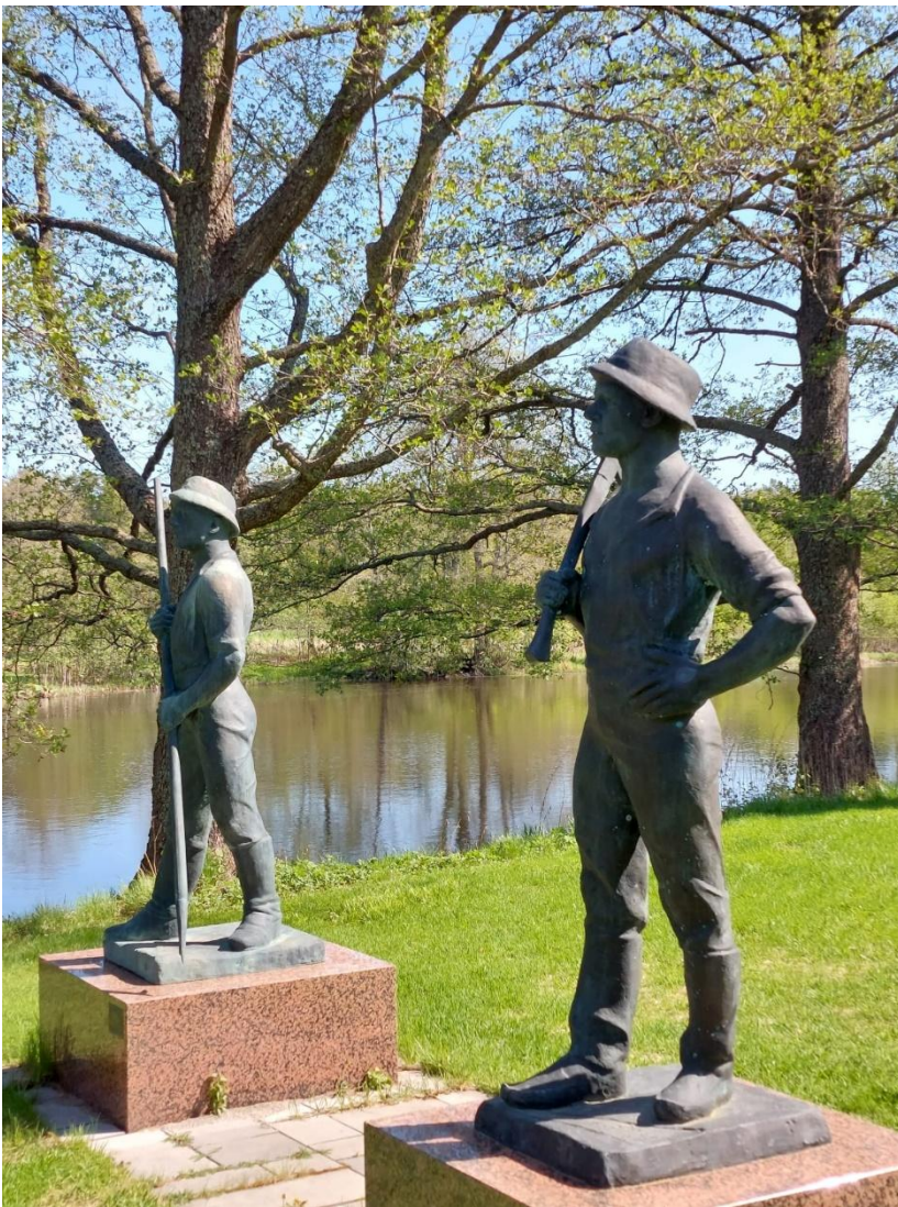
Emil Cedercreutzin veistokset