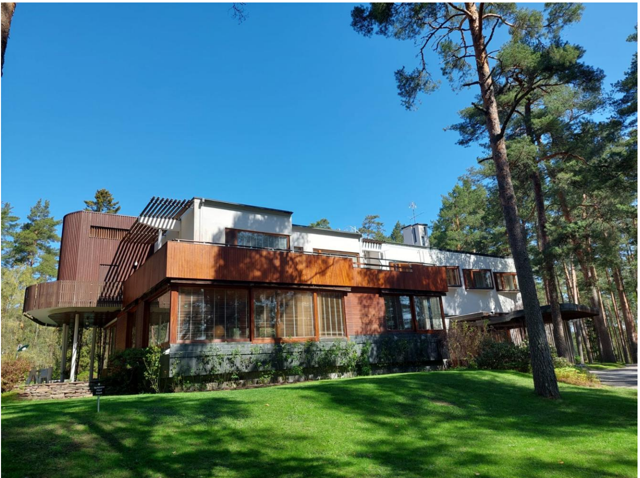
Villa Maire, suunnitellut Alvar Aalto