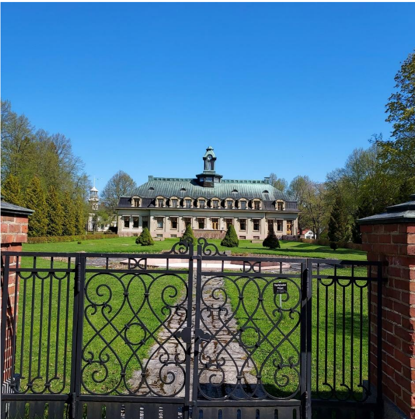
Ahlström yhtiön edelleen toiminnassa oleva päärakennus